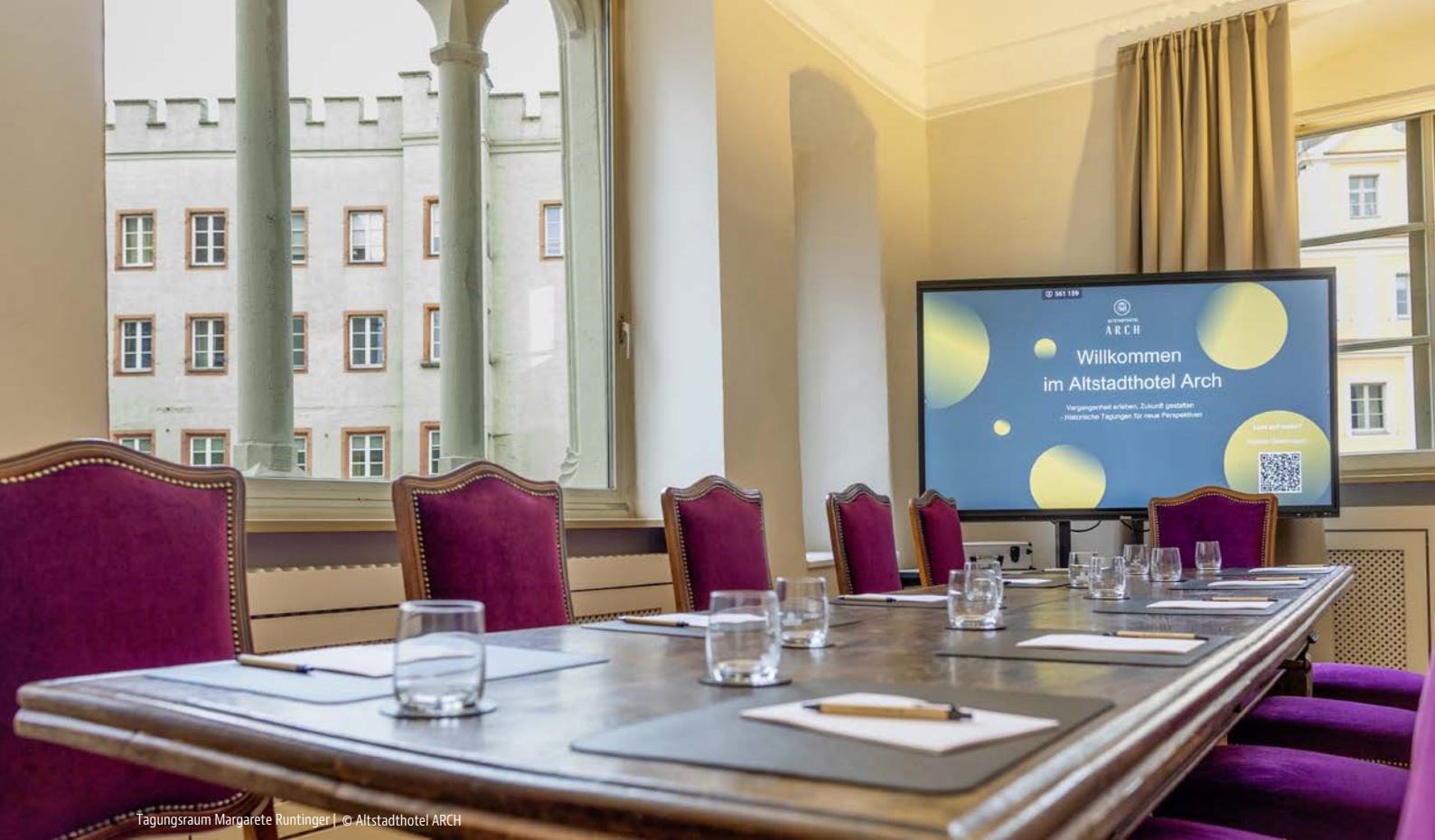
Tagungsraum Margarete Runtiger