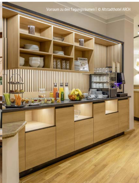
Vorraum zu den Tagungsräumen